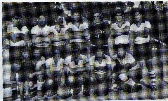
EQUIPO CAMPEON TORNEO 1962

ilustran estas páginas como un antecedente histórico del evento, hecho muy importante y de grandes comentarios en el mes que termina en Barón.